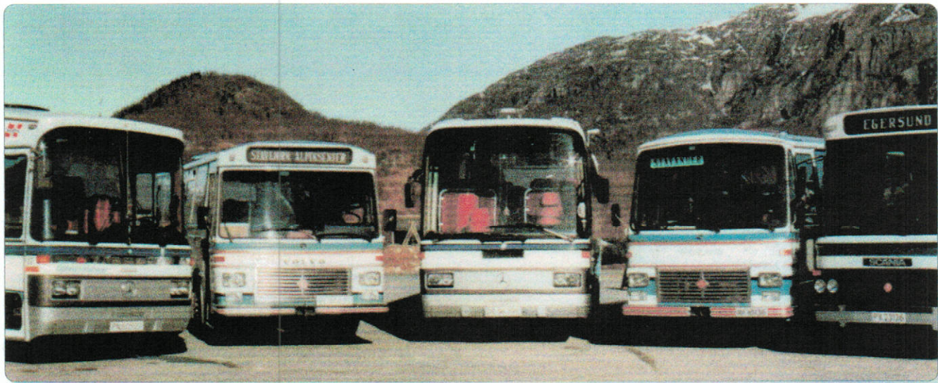
Fra venstre: PN60522 (int. nr 27) MB 303 1982 mod. Føreland, SC43653 (int.nr 22 i "nye farger) Volvo B58 1979 mod., Repstad, DD96398 (int.nr29) MB 0303 1984 mod. RF101368 (int.nr 25) Volvo B60 1980 mod. Repstad og PX23136 (int.nr 30) Scania K112 1985 mod. Repstad. #