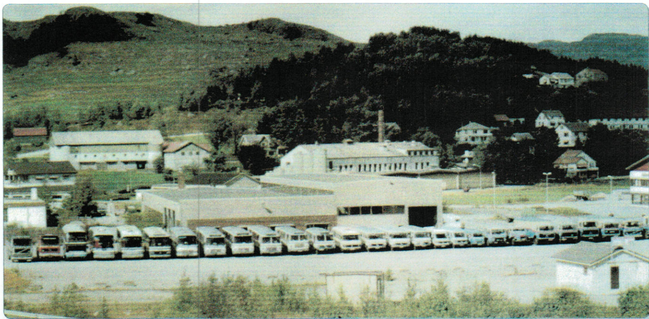
Bilparken foran garasjen på Vikeså 1988.