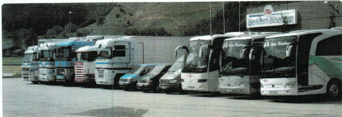
Bilparken 2008, de tre bussene til høyre var innleid til turkjøring for Sør-Vest Reise(1 buss fra Suldal Billag, 2 fra Odda Rutebil).