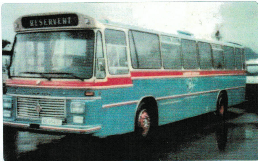
Volvo B58 Repstad 1979 modell reg. nr. SC43653, int.nr 22 i selskapets "gamle farger".