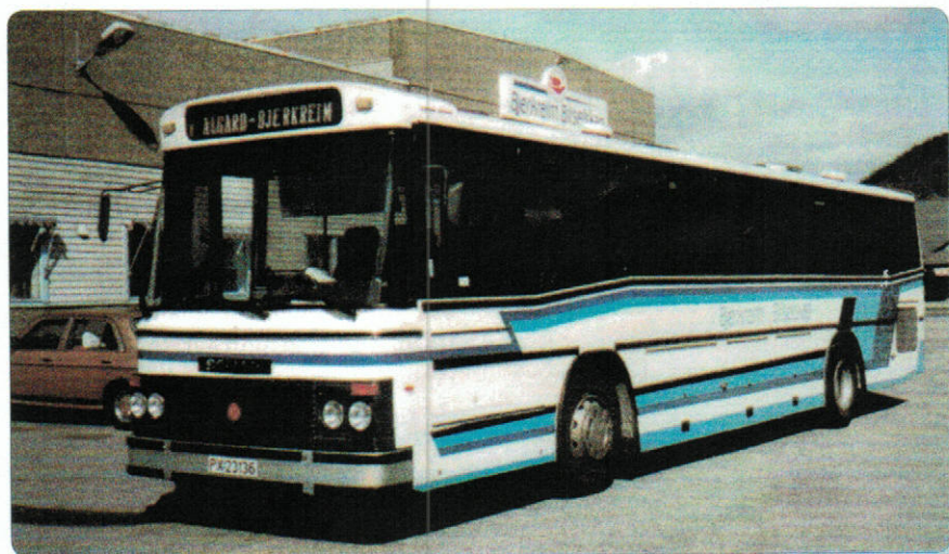
Scania K112, PX23136, 1985 modell, int. nr 30 Repstad

med langtransport, til blant annet Portugal.