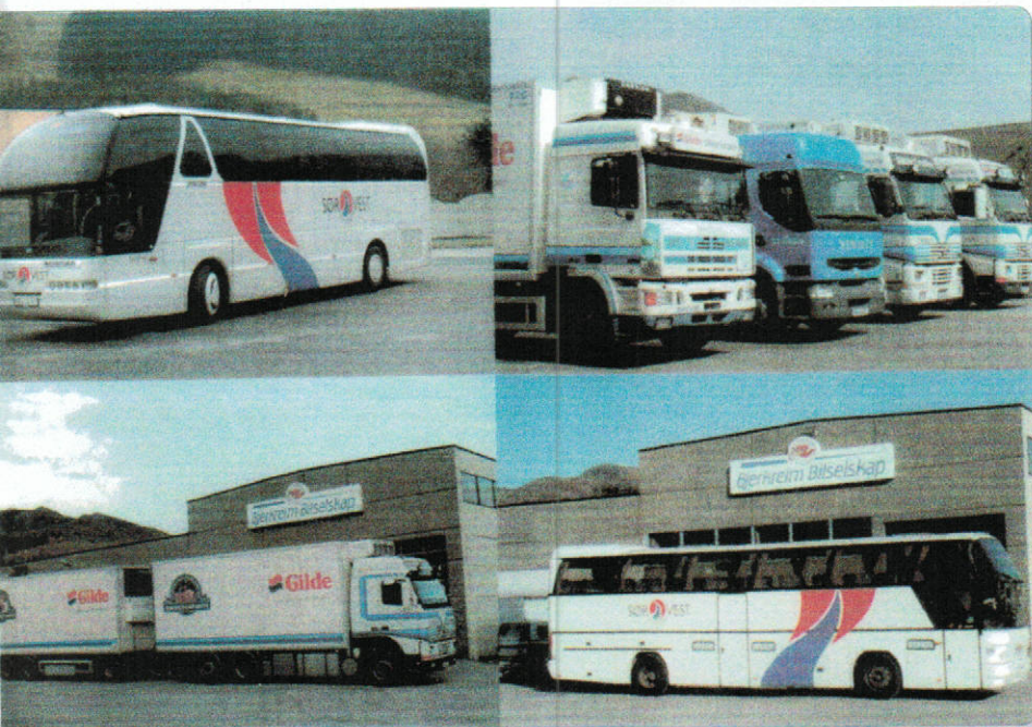
Øverst til venstre: Neoplan Starliner int. nr 31, 1997 modell, øverst til høyre: fra venstre Gilde ekspress DAF 95/430 1987 mod. Renault premium int.nr 5 1999 mod, Gilde ekspress Volvo FH12 int. nr 8 2000 mod, Gilde ekspress Volvo FH12 int.nr 1 2004 mod. Nederst til venstre: Gilde ekspress Volvo FH12 int. nr 1, 2004 modell, Nederst til høyre: Neoplan Cityliner RZ17410 1993 mod. int. nr 29

I 1989 kjøpte selskapet en termovogn av Brødrene Hølland på Vikeså. De hadde transportavtale med AGRO (senere Nortura) for frakt av kjøttvarer til Østlandet med Gilde Ekspressen. Senere ble det også utvidet til transport for Prior til Agder-fylkene. På det meste disponerte Bjerkreim Bilselskap A/S 5 vogntog til denne aktiviteten. Avtaler med Håkull Transport ble også inngått og dermed var selskapet i gang