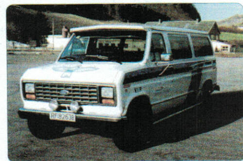
Ford Space Wagon, RF82638, 10 seter 1990 modell int.nr. 19.