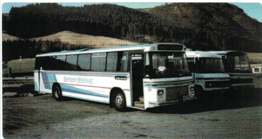
Fra venstre: Volvo B58, SC43653, 1979 modell, int.nr 22 (omlakkert for 3. gang) solgt juli 2000, MB 0309D, Int.nr 28 (kan dessverre ikke finne ut av reg.nr og modell, etter mye arbeid), MB 01117 DF38037, int.nr 15, 1988 modell.

Bjerkreim Bilselskap AS kan derfor i 2016, som det eldste busselskapet i Rogaland, feire 100 års jubileum!!!