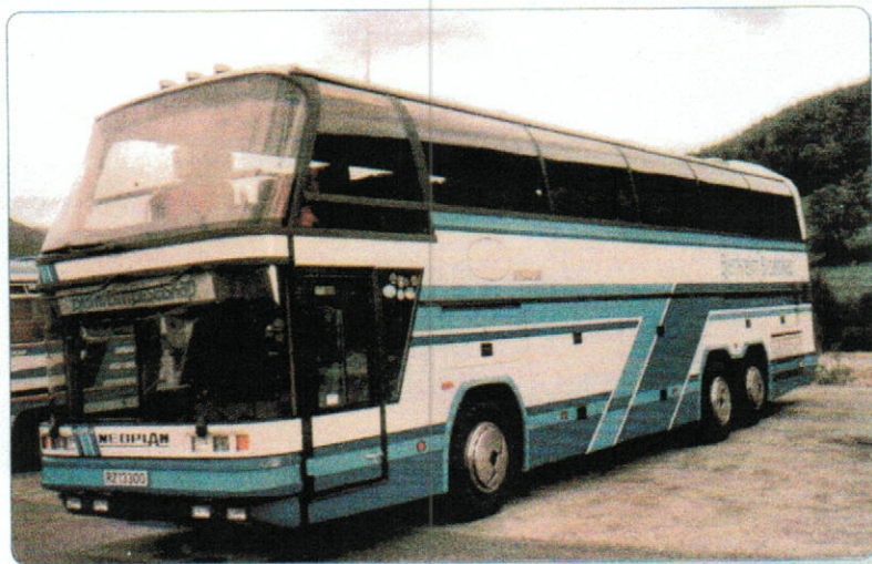
Neoplan Spaceliner, RZ13300, Scania motor K113, 1987 modell, int. nr 31. Bussen ble senere omlakkert til Sør-Vest reiser sine farger, solgt april 1999 til Rennesøy Trafikk.

Utover på nitti-tallet begynte 2. generasjon å trekke på årene. Det begynte også å bli mye snakk om at bussrutene i Rogaland skulle legges ut på anbud. Styret mente av bedriften var for liten til å gi seg i kast med å regne på store bussanbud. Det ble derfor besluttet av eierne, familiene Vassbø og