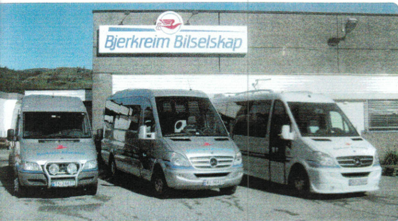
Bilparken i 2011 fra venstre MB Sprinter, TS 24671, int. nr 17, 2005 modell, MB Sunset, R390423, int. nr 20, 2008 modell og MB Euroline, RZ31664, 2008 modell.