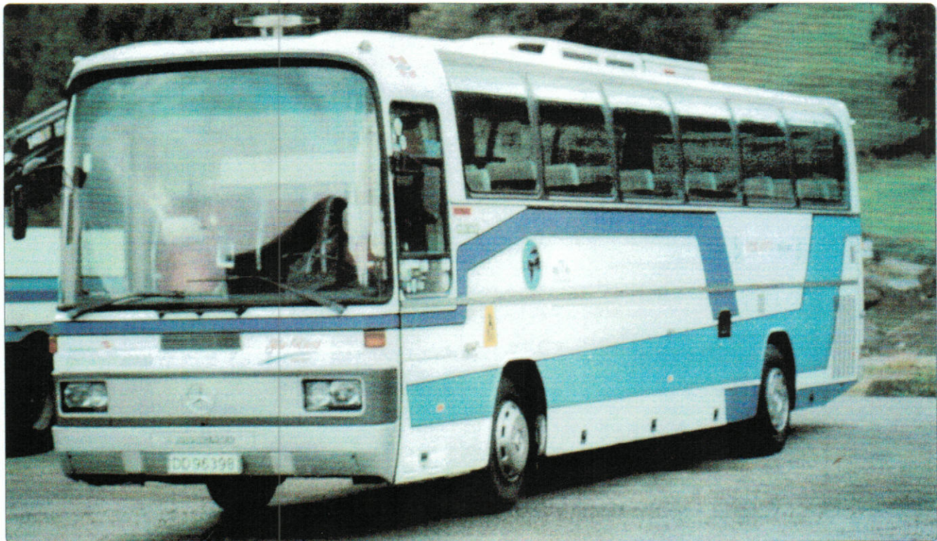
Mercedes Benz O303 DD96398 1984 modell int. nr 29