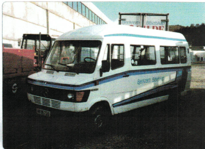
Mercedes Benz, RF16723, 1981 modell, 207D

Slettebø, at selskapet skulle legges ut for salg. I 1997 kom dermed NSB Biltrafikk inn som ny eier i Bjerkreim Bilselskap AS. Flere andre lokale rutebilselskap led også samme skjebne, da store nasjonale eller internasjonale selskap kom inn på eiersiden.