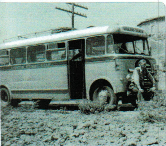
Fra Spania tur i 1953. Det er en Bedford med Repstad karosseri. Reg. nummer var L-22033.